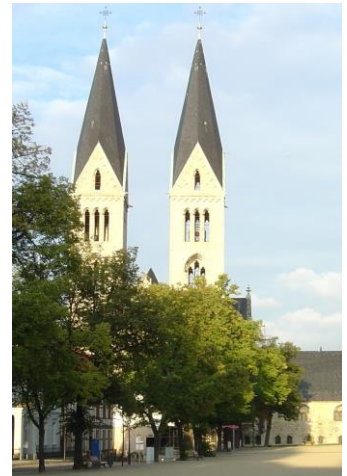
Der Dom zu Halberstadt