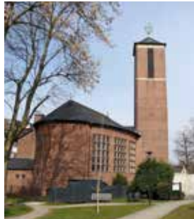
Lukaskirche in Eckesey